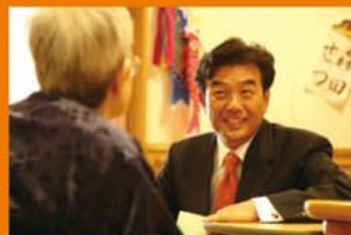
特養老人ホームの増設