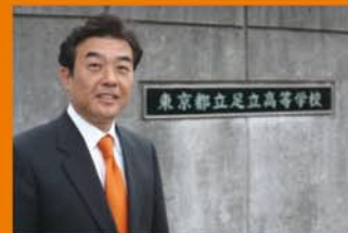
都立高校の無償化