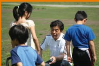
待機児童数を半減

都議会議員としてまもなく 4 年、これまで精力的に取り組んできた活動の一例です。