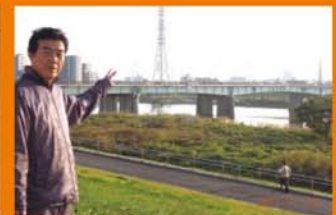
河川防潮堤の耐震化